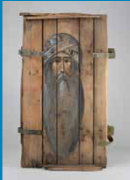
Oleksandr Klymenko/Sofia Atlantova, Hl. Antonius vom Kyiver Höhlenkloster