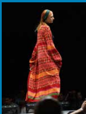
Modeentwurf aus der Kollektion „Azania“ von Modedesignerin Wadzanai Marowa, 2022, Stadtmuseum Simeonstift Trier, Foto: Dr. Bernd Röder